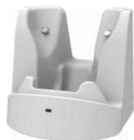
シングルスロット充電クレードル (通信対応)