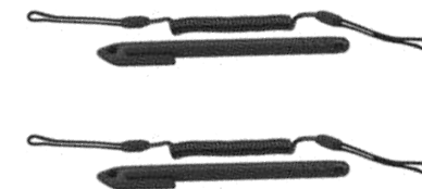
スタイラス (コイルコード付き)