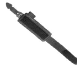
ハンドストラップ