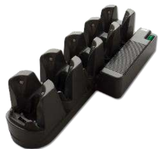
電源搭載5スロット充電クレードル