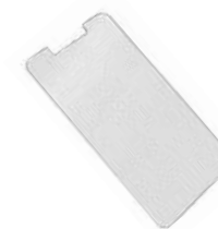
スクリーン保護シート