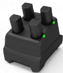
4スロット バッテリー充電器