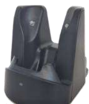
シングルスロット充電クレードル